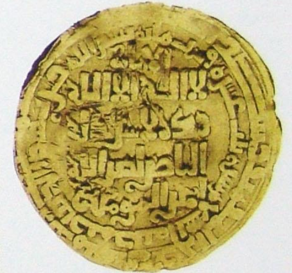
دينار عباسي الناصر لدين الله ضرب: مدينة السلام سنة: ٦١٣ هجري Abasids Dinar Al Nasser Ldeen Allah struck at Medinat El-Slam Year: 613 H